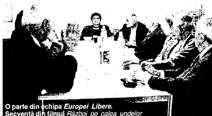
Fig. 6. O parte din echipa Europei Libere. Secvență din filmul „Război pe calea undelor”