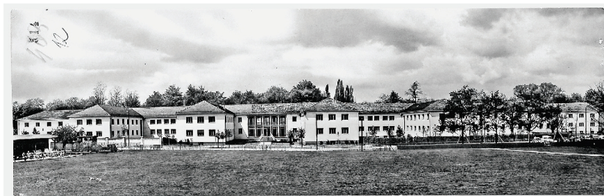
Fig. 2. Vedere completă a clădirii Radio „Europa Liberă”/Radio Libertatea în clădirea Englischer Garten din centrul orașului München