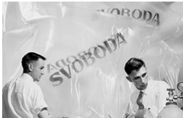
Fig. 4. Baloanele au fost umplute cu hidrogen