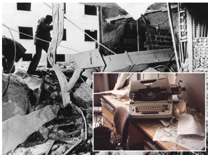
Fig. 5. Sediul bombardat al REL/RL, München, 21 februarie 1981