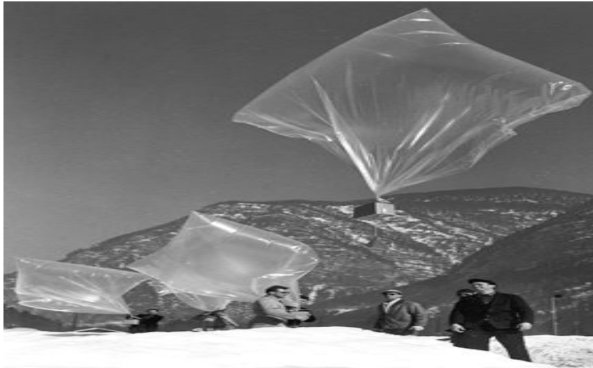
Fig. 3. Baloanele care transportau cutii cu pliante al căror text le spunea oamenilor că o nouă speranță s-a ivit. „Milioane de bărbați și de femei s-au unit și împreună au trimis acest mesaj de prietenie pe Aripile Libertății, care suflă întotdeauna de la Vest la Est”. Pe spatele pliantelor au fost enumerate lungimile de undă ale marilor stații ale lumii libere care transmiteau în Cehoslovacia.