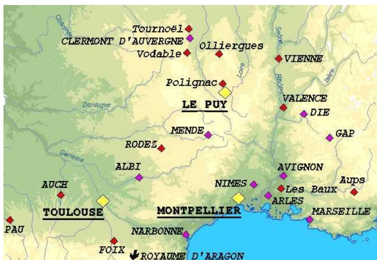
Fig. 2 - Harta care prezintă peregrinările lui Peire Cardenal în timpul vieții sale în sudul Franței.