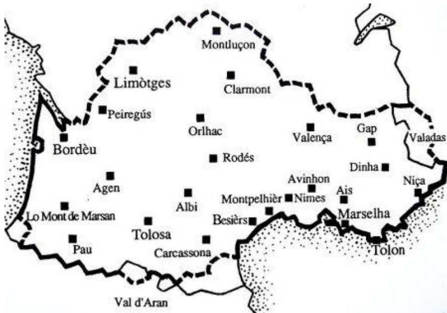
Fig 1 - Orașe din Occitania în care au fost prezenți trubadurii.